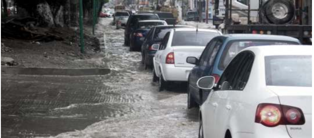
Página 4 / Locales

● Eliminado el 15% del Paseo de la Burrita, no solamente dos árboles, con deficiencias en los trabajos que cada día son más evidentes, drenaje, alcantarillado, desniveles, rampas y facilidades para personas con capacidades especiales, entre otras, sin solucionar el mal llamado problema de la vialidad que se empeora con accidentes por las fallas en la infraestructura vial por la falta de proyecto