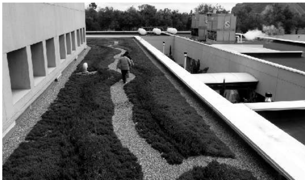
La azotea verde del Hospital Belisario Domínguez

Desde entonces, al cumplir los dos años, los niños suben a conocerla. Los más grandes, de entre tres y seis años, trabajan en un pequeño huerto, donde hacen compost (abono orgánico) y cultivan tomate, papa, perejil, manzanilla y cactus.