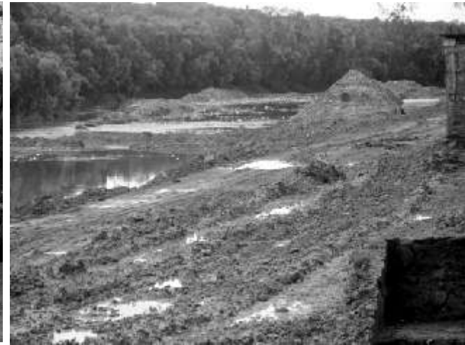
EL RÍO CAZONES JULIO DE 2009