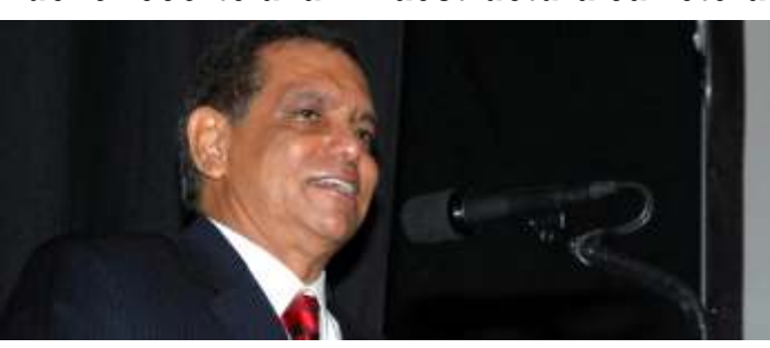
Página 6 / Estado de Veracruz

Considera FHB inadecuado e indebido el nuevo recorte a la infraestructura carretera