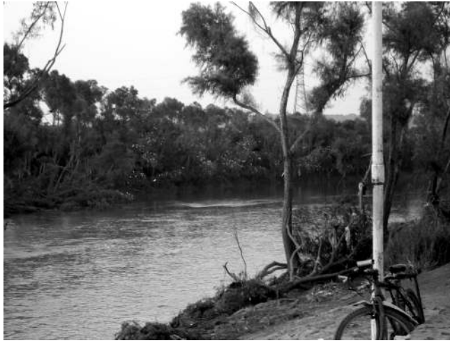
EL RÍO CAZONES OCTUBRE DE 2007