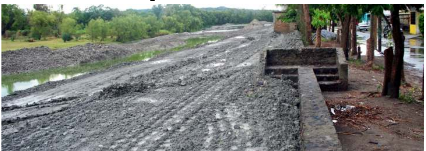
Aspecto de la depredación irracional del Río Cazones para hacer un malecón Página 5 / Locales