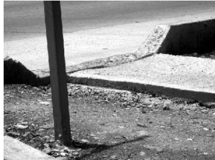
Rampas construidas después de tiempo ¡Y MAL!

A decir de la ciudadanía, y sin entrar en controversias de cuánta gente se queja, algunos pocos, aseguran que "La ampliación es un fraude"