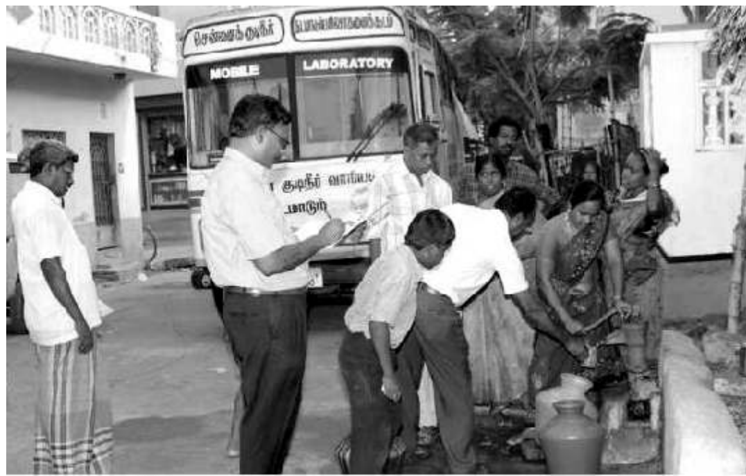
Mobile Laboratory for testing the quality of water Government of Tamil Nadu

Históricamente, el agua fue almacenada en diferentes sistemas de cavado en la tierra para usar en la agricultura, para beber y con fines