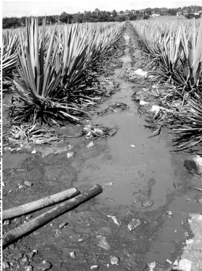
Residuos líquidos en una plantación de agave.

"Las vinazas son ácidas, tienen un aceite que impermeabiliza los suelos y están a temperaturas altas cuando son vertidas. El ácido no es recomendable para la agricultura, debe neutralizarse. El aceite vuelve impermeables y duros los suelos, no sirven para la