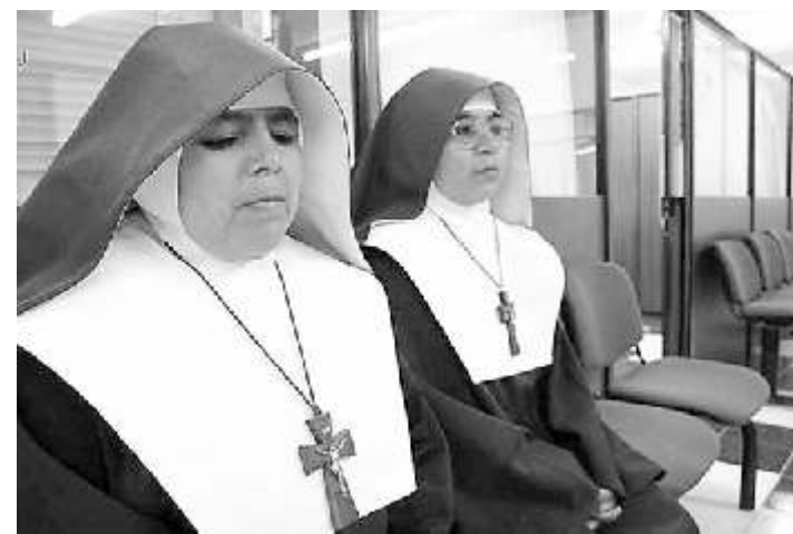
Catedral de Dolores Hidalgo

El jueves pasado, las religiosas se presentaron ante el fiscal ataviadas con hábitos en color café y blanco y una cruz colgado al cuello, para presentar su denuncia por abuso de autoridad, y por arrojaron sus credenciales y un documento expedido por la Secretaría de Gobernación para acreditar que pertenecen a la "Congregación de Frailes