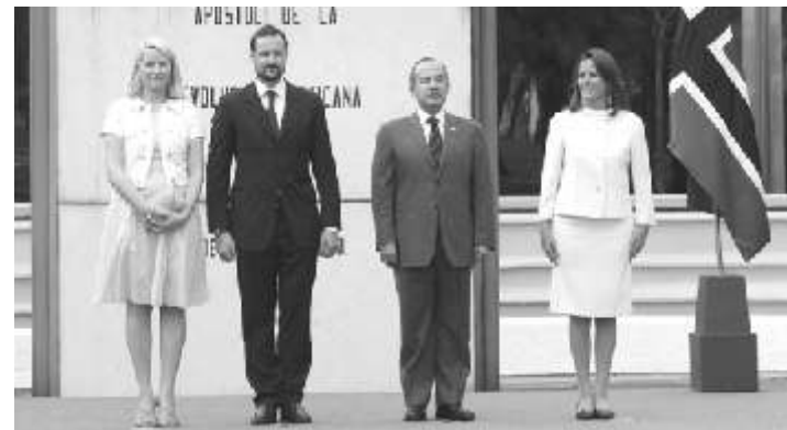
El presidente Felipe Calderón y su esposa Margarita Zavala, en la ceremonia oficial de bienvenida de los príncipes herederos de Noruega, Haakon y Mette-Marit

ofrecerá una cena oficial de bienvenida en el Museo de la Ciudad.