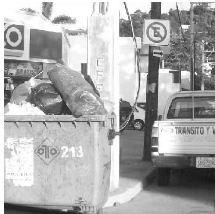
Contenedor contrario al reglamento de limpia pública, colocado entre los palacios municipales de Poza Rica, y la camioneta de Tránsito y Vialidad municipal estacionada en lugar prohibido, si eso no es prepotencia...

Para después Villa Salas enfocarse a la pregunta y comentar que están redoblando esfuerzos, y saben que hay un exceso de basura, todo por las fiestas de navidad y los reyes, pero dijo, que si se va