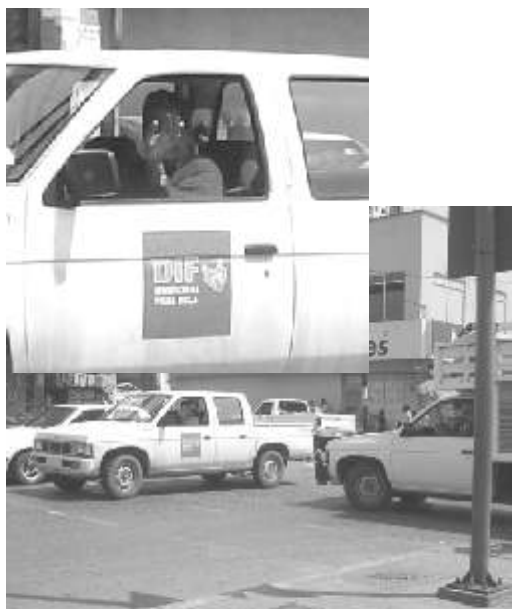
Quiéren autoridades terminar con problemas viales, circulación y estacionamiento, y la camioneta del DIF municipal estacionada en doble fila y esquina, en el centro de Poza Rica, estorbando el paso, el chofer ni la cara quiso dar

Ante concluir la entrevista en su oficina, afirmó que puntuales en el pago, fueron los del 2 por ciento a la nómina, agregó, que Poza Rica se caracteriza por ser un Distrito con pagos muy puntuales.