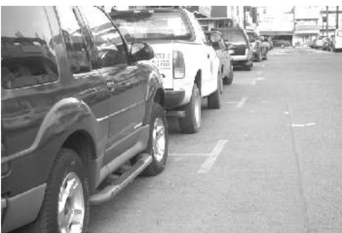
Ya están marcados los espacios en las colonias del centro para 450 parquímetros en la primera etapa

El Pleno Legislativo autorizó al Ayuntamiento de Poza Rica otorgar concesión para instalar, operar, mantener y administrar la explotación de parquímetros en la vía pública, a favor de la empresa "Sistemas de Monitoreo Vial" por una lapso de 15 años