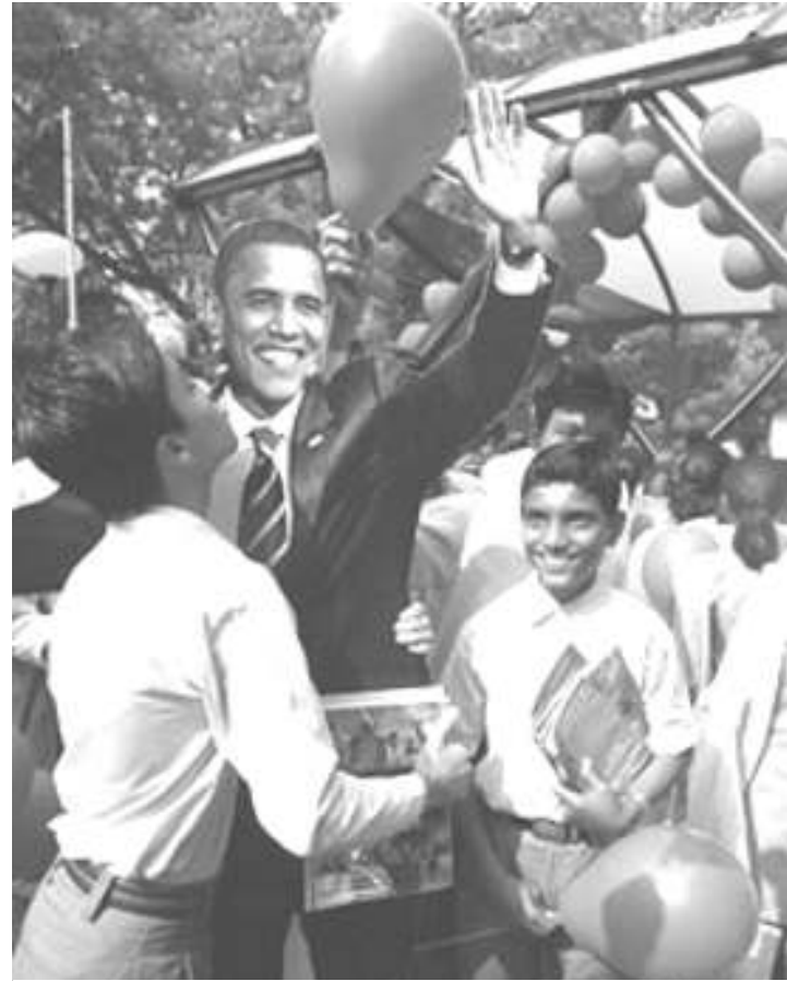
Un chico besa la imagen de cartón de Barack Obama en una fiesta en Nueva Delhi