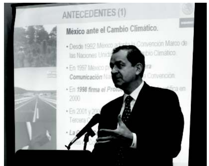
El titular de la Secretaría de Medio Ambiente y Recursos Naturales (Semarnat), Juan Rafael Elvira Quesada

"Los términos pactados en el contrato de préstamo no definen los tiempos en los que se realizarían las reuniones para intercambiar puntos de vista sobre los logros avanzados durante la realización del programa, ni para elaborar los informes sobre su implementación, situación que obstaculiza la programación y evaluación del cumplimiento de los objetivos y las metas del programa y de las acciones pactadas en el contrato", detalla el órgano fiscalizador.