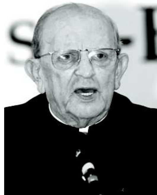
El padre Marcial Maciel

"Cuando estás en medio de la tormenta no ves las cosas claras, hasta que